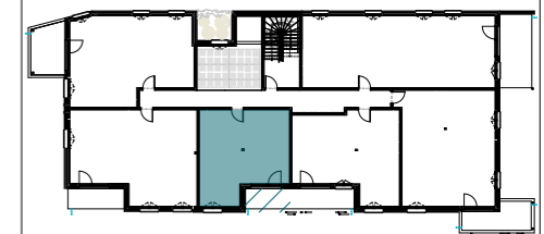
PLAN DE REPERAGE - LOGEMENTS