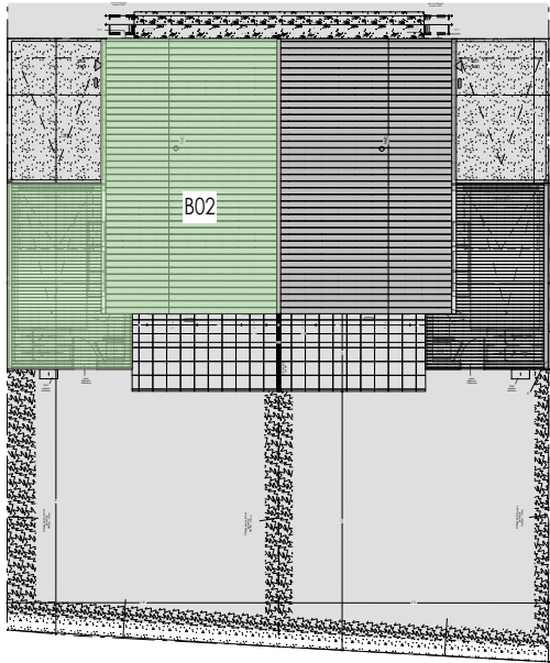
Plan de masse Ech : 1/300è

Architecte : ATELIER D'ARCHITECTURE LE GARZIC 29 rue Nantaise 35000 RENNES 02 99 30 31 11